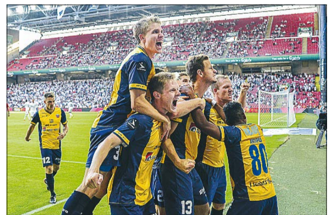
Hobro IK's hidtidige højdepunkt i Superligaen kom i fjerde spillerunde, hvor holdet slog FCK 3-0.

især de tidligere spillere, der bidrager med merværdi i forhold til alt det materiale, vi allerede har stiftet bekendtskab med i medierne. Bogen er præget af et sympatisk persongalleri, som mange kan identificere sig med, og man kan ikke undgå at blive opslugt af historien.