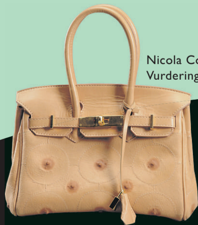
Nicola Constantino Vurdering 10.000