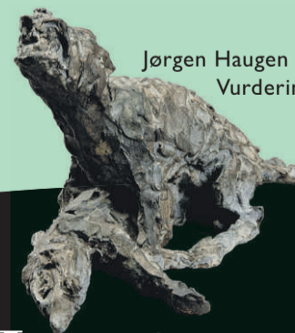
Jørgen Haugen Sørensen Vurdering 20.000