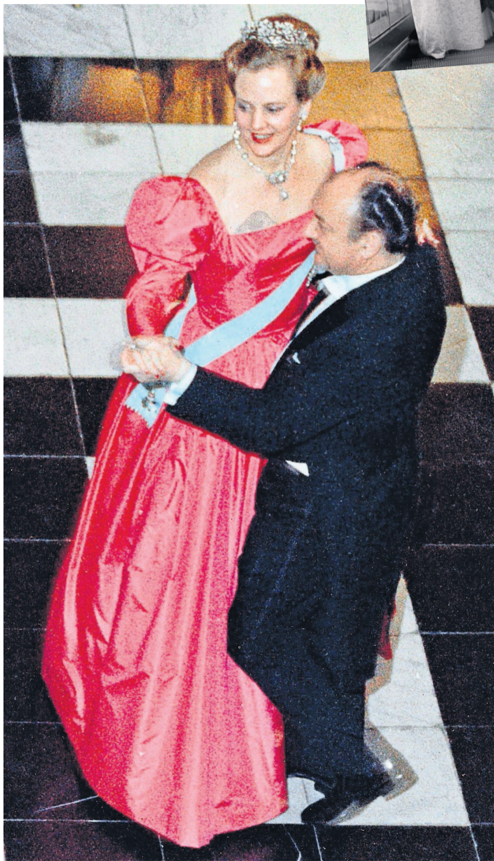
Daværende statsminister Anker Jørgensen og Dronningen på dansegulvet, Christiansborg, 1980. De var begge glade for at danse. Og gode til det. Foto fra bogen.