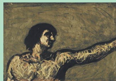
Kurt Trampedach · Vurdering 60.000