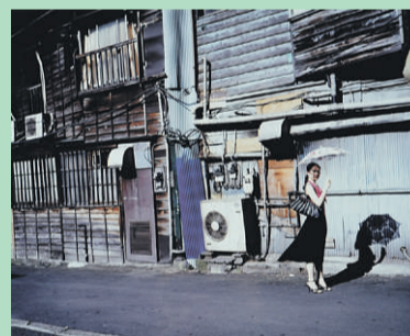
Nobuyoshi Araki · Vurdering 15.000