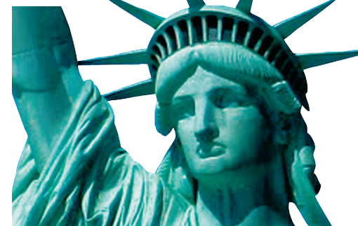
Amerika. Fuser fra Don DeLillo – Perle fra Richard Yates. Side 6 og 12