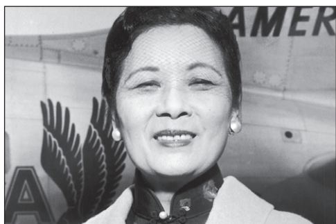
Madame Kina. Biografi om en sexet herskerinde. Side 10