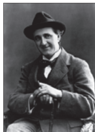
Bliv klogere på Robert Storm Petersen i Storm P.-Museets ni fantastiske udstillingsrum.